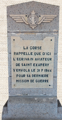
Gedenkstein am Flughafen Bastia/Korsika

Unsere Ausstellung ist dem berühmten französischen Schriftsteller zu dessen 80. Todestag (31. Juli 2024) gewidmet.